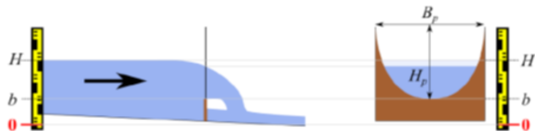
d) schemat przelewu kołowego z zaznaczeniem wartości mierzonych