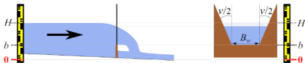
c) schemat przelewu trapezowego z zaznaczeniem wartości mierzonych